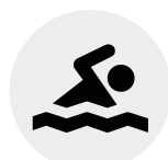
Piscinas Swimming Pools