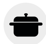
Cocinas y restaurantes Kitchens and restaurants