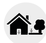
Residencial. Interior y exterior. Residential. Outdoor & Indoor.