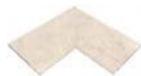
CARTABÓN INTERIOR BORDE TÉCNICO CE-12211 JG/119 625 x 625 x 23