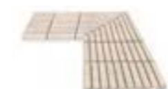
ESQ. REJILLA CERÁMICA EVACUACIÓN: 19 m³/h CE-12226 JG/122 450 x 450 x 25