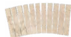
REJILLA CERÁMICA CURVABLE EVACUACIÓN: 19 m³/h CE-12229 PZ/123 500 x 245 x 25