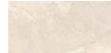
BASE CE-12198 M 2 /003 625 x 310 x 10