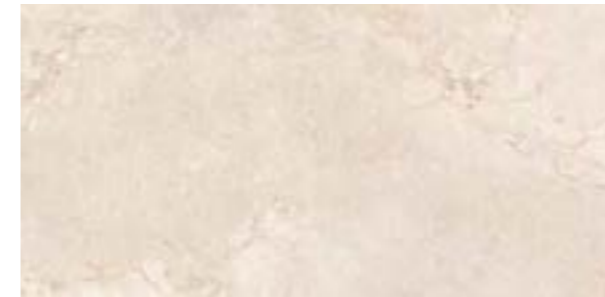
BASE CE-12194 M 2 /005 1200 x 600 x 10