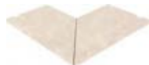
CARTABÓN EXTERIOR BORDE TÉCNICO CE-12214 JG/119 625 x 625 x 23