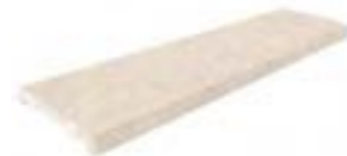
REJILLA OCULTA REGISTRABLE CE-12232 PZ/126 500x126x20 mm (Grosor 12mm)